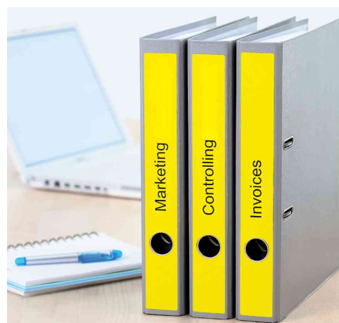
Étiquettes pour dos de classeur SPECIAL, utilisation