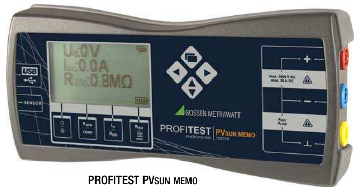
PROFITEST PVsUN MEMO