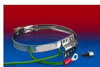
CLAMP 212 EC