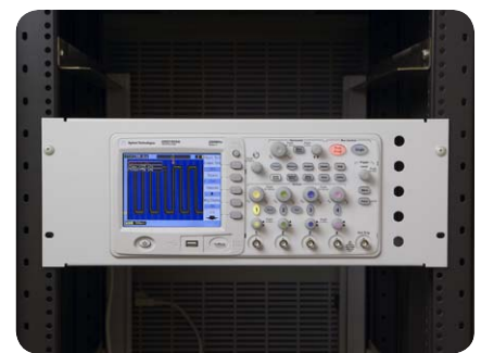
Gestelleinbausatz für Familie 1000