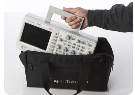
Tragetasche für Familie 1000