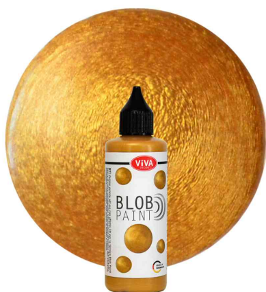
Visuel de référence : Blob Paint Metallic, 90 ml