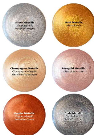
Aperçu des couleurs