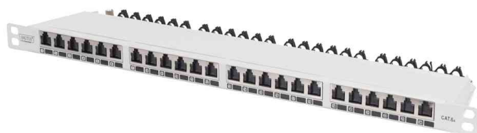
19" Patch Panel Kat. 6A, Klasse EA, grau