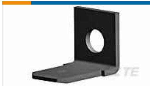
TE Teilnr.:42214-2 250 FASTON TAB TPBR