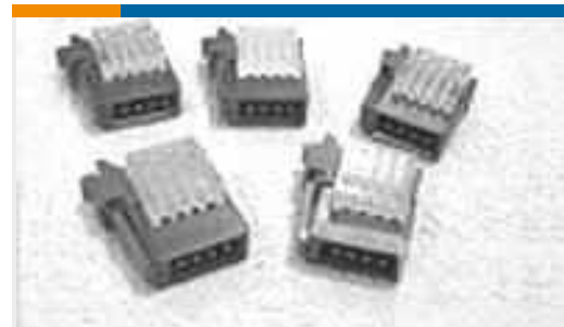
TE Teilnr.:1473562-3 RITS CONN. PLUG ASSY 3P YELLOW