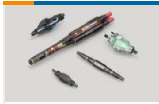
Muffen und Kabelverbinder(1)