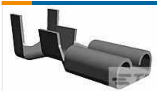
TE Teilnr.:170467-1 187 FASTON,REC.,18-14 AWG,TPPB