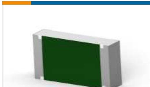
TE Teilnr.:5-2176397-4 3502 160R 1%