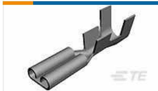
TE Teilnr.:170203-2 187 FASTON,REC.,24-20 AWG,TPBR