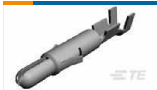
TE Teilnr.:350706-7 UMNL SPLIT PIN 24-18 AUBR L/P