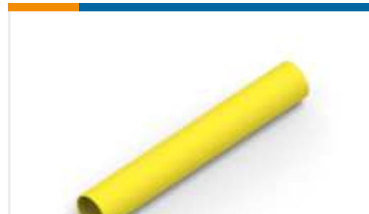
TE Teilnr.:NB19832001 RNF-100-3/32-YO-STK