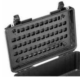
1535MP EZ Click MOLLE Panel