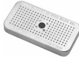
1500D Desiccant Silica Gel