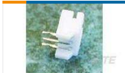
TE Teilnr.:1-440055-1 2.0MM,HDR,11POS,R/A