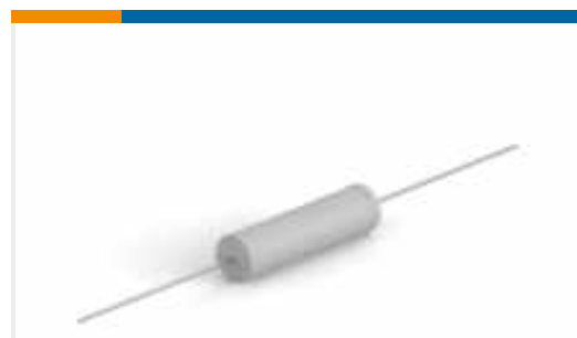
TE Teilnr.:4-2176414-8 7W STD M/OX 5% 1K8