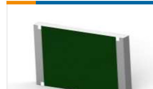
TE Teilnr.:8-2176407-8 3560 27R 5%