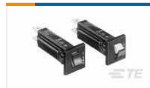
TE Teilnr.:1-1393250-7 W28-XQAT-15=W28