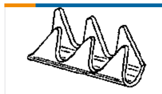
TE Teilnr.:926933-1 WIRE PIN 18-17 AWG .01 PTPB