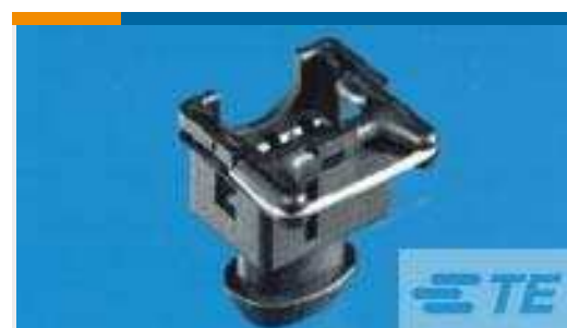
TE Teilnr.:963040-2 2P JUN-TIMER GEH