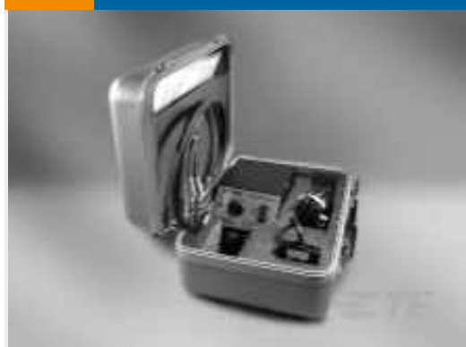
TE Teilnr.: 173643-000 RH-3960-1-TINEL-KIT-120V