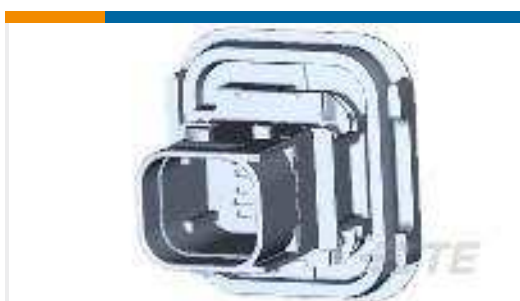
TE Teilnr.:1-1703808-1 4POS,TAB 2.8X0.8,TAB HSG,ASSY,