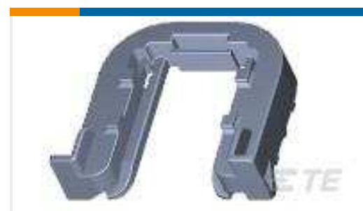
TE Teilnr.:1703810-1 SLIDE,TAB HSG GROUP B