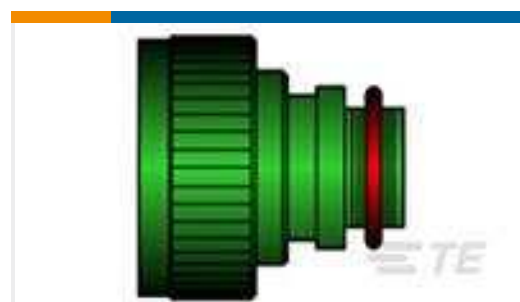
TE Teilnr.:421397-000 TXR40AB00-2014AI