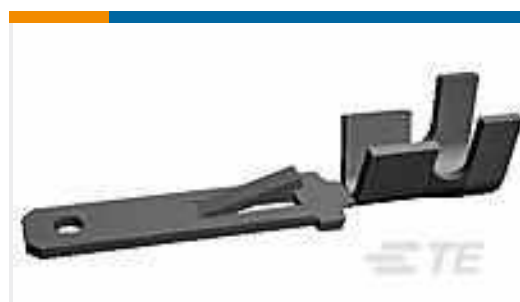
TE Teilnr.:42565-2 FF 250 TAB 18-14AWG TPBR PRE CRIMPED