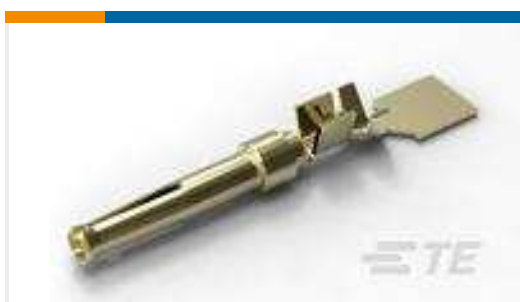
TE Teilnr.:5-166051-1 HD 20 SOCKET ON MINI-REEL 500