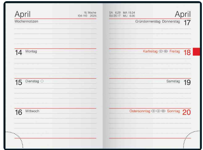
Taschenkalender "partner/Industrie I" - Innenansicht