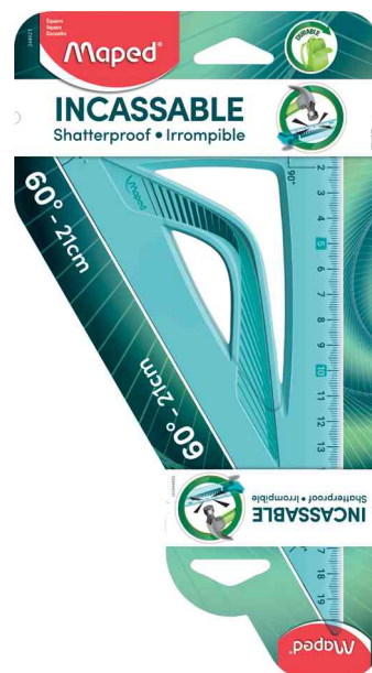
Zeichendreieck Flex 60°, blau