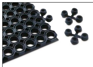
Schutzfangmatte Typ OM mit Drainagelöchern (Ø 28 mm) und Verbindungselementen