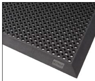
Schutzfangmatte Typ OB mit kleinen Drainagelöchern (Ø 14 mm) und abgeschrägten Kanten für stolperfreien Zugang