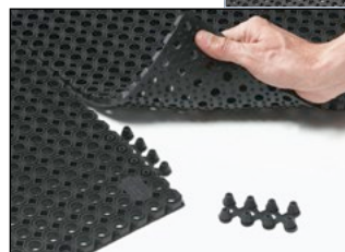
Schutzfangmatte Typ OF mit Drainagelöchern (Ø 14 mm) und Verbindungselementen