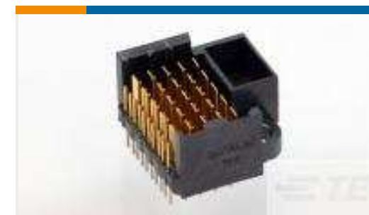
TE Teilnr.: 5120680-2 Z-PACK HS3 HDR 6R RH FT