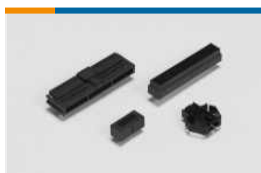
Anschlusswannen für Leiterplatten-Steckverbinder(2)