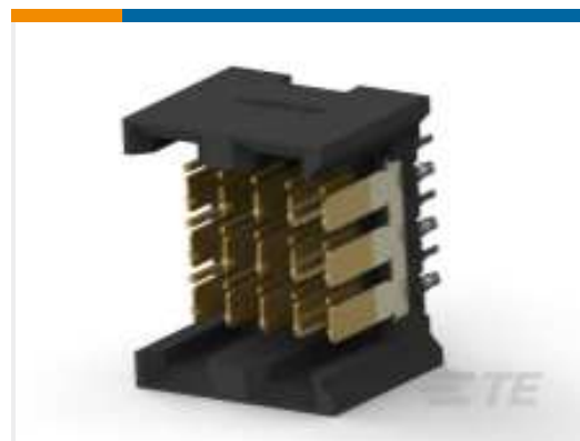
TE Teilnr.: 5120677-1 Z-PACK HS3 HDR ASSY 6R 30P RH