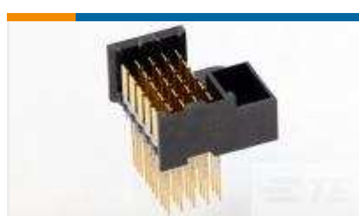
TE Teilnr.: 5120839-1 Z-PACK HS3 HDR ASSY 6R 30P RH