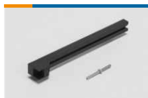
Hardware für Stiftwannen- und Buchsenführungen(1)