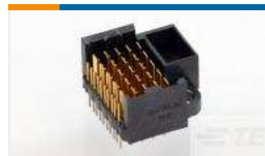
TE Teilnr.: 5120680-1 Z-PACK HS3 6R 30P HDR RH FT