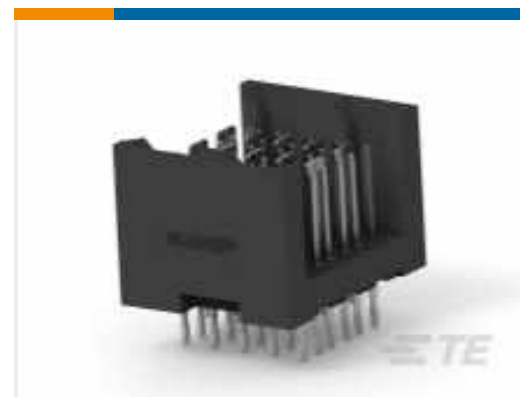
TE Teilnr.: 5120677-2 Z-PACK HS3 HDR ASSY 6R 30P RH