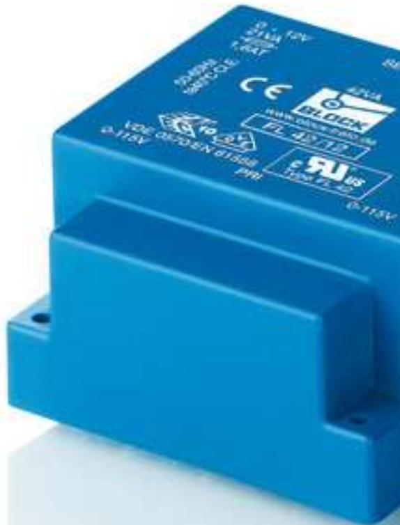
Abbildung zeigt FL 42/12