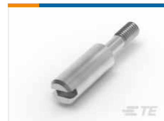
TE Teilnr.:T0931003003-000 CODING-PIN-M3