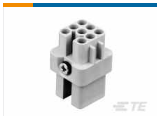
TE Teilnr.:T2020082201-000 HD-008-F