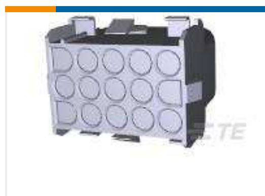
TE Teilnr.:1-480711-9 15P UMNL CAP HSG BLK