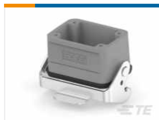
TE Teilnr.:T1730060000-000 H6B-TBF-T