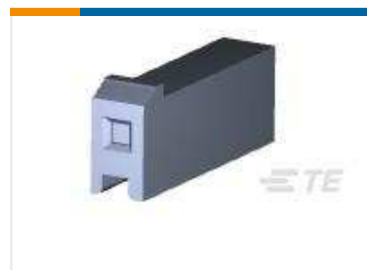
TE Teilnr.:640250-1 01P SL156 HSG W/LCK RAMP NATL