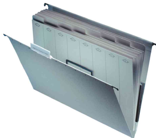
Dossier suspendu Universal