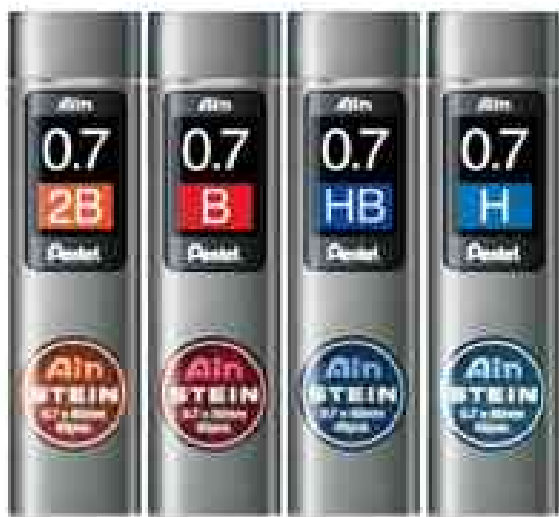
Visuel de référence: Porte-mines AIN STEIN - 0,7 mm