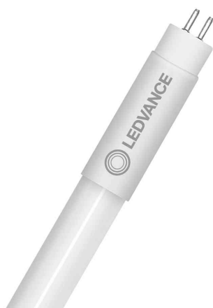
Visuel de référence : tube LED T5 SHORT