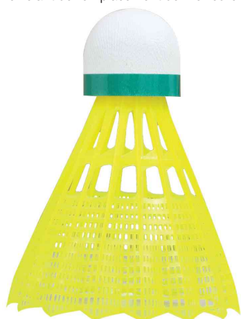
Visuel de référence : Volant de badminton Tech 350, lent