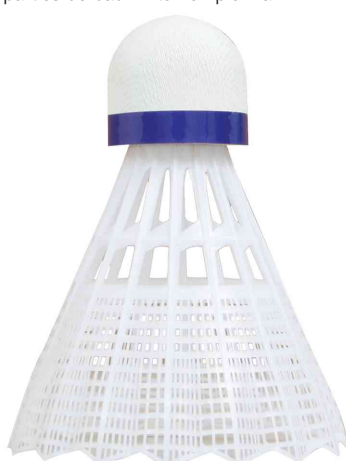
Visuel de référence : Volant de badminton Tech 350, moyen