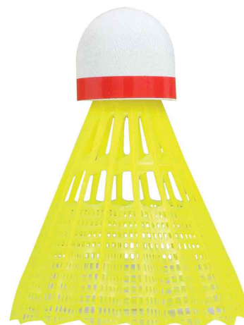
Visuel de référence : Volant de badminton Tech 350, rapide