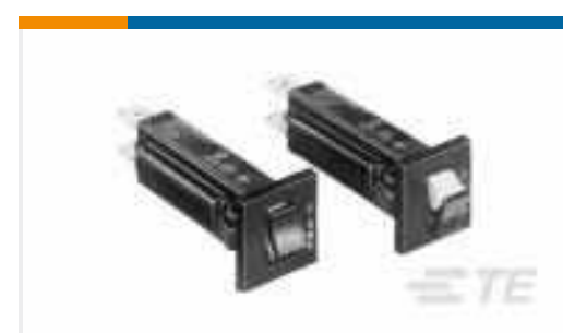
TE Teilnr.:1-1393250-7 W28-XQAT-15=W28