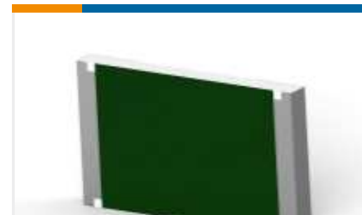
TE Teilnr.:8-2176407-8 3560 27R 5%