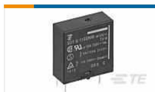
TE Teilnr.:8-1419125-5 SDT-S-106LMR,000