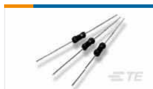
TE Teilnr.:4-1879350-2 RR01 5% 11R AMMO