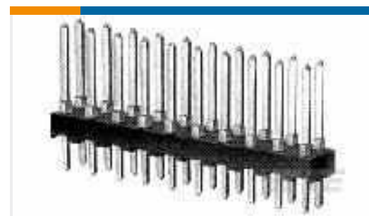
TE Teilenummer87227-7 14 MODII HDR DRST UNSHRD .100