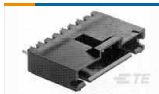
TE Teilenummer5-104362-1 02 MTE HDR SRST LATCH W/HLDWN