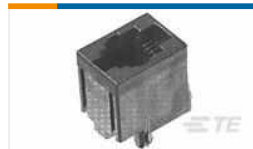
TE Teilenummer5520425-3 MJ,TE,6P/6C,BULK PAC