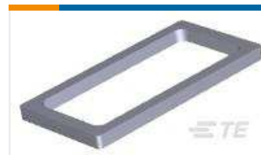
TE Teilenummer794772-8 08P MINI UMNL SEAL,DIE CUT