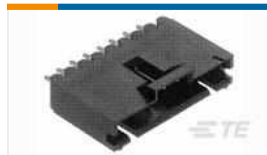
TE Teilenummer5-103908-3 04 MTE HDR SRST LATCH W/HLDWN