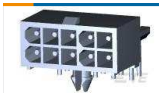
TE Teilenummer1-770971-0 10P MINI UMNL R/A HDR ASSY SN