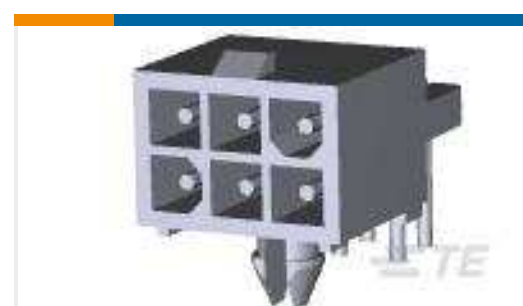
TE Teilenummer1-770969-0 06P MINI UMNL R/A HDR ASSY SN