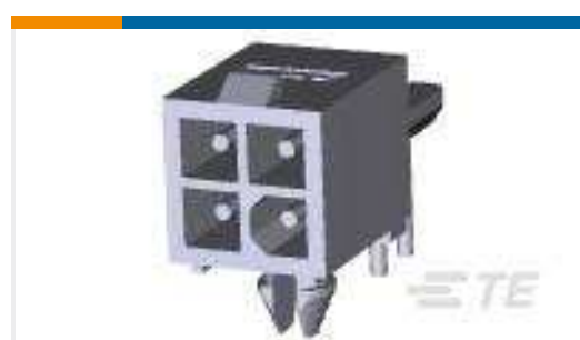
TE Teilenummer1-770968-0 04P MINI UMNL R/A HDR ASSY SN