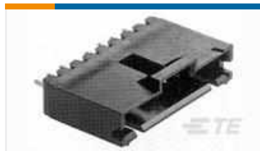
TE Teilenummer5-104362-2 03 MTE HDR SRST LATCH W/HLDWN