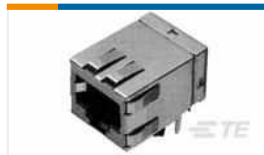
TE Teilenummer5406299-1 MJ ASSY,S/P,8POS,SH,RVPGT,CAT 5e