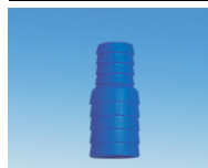
Entlüftungsstutzen / vent connection C1.0605.01