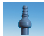
Rückschlagventil mit Entlüftung / non-return-valve with venting 3004.53.00