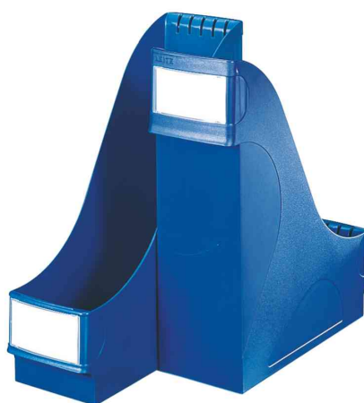
Porte-revue extra large, bleu