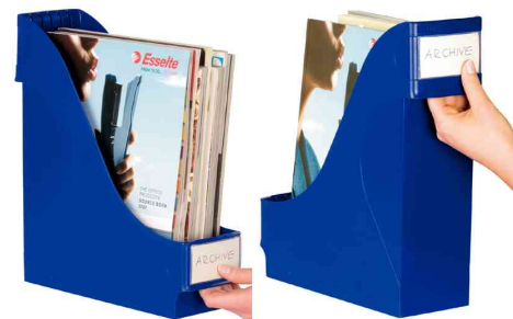
Visuel de référence: Porte-revue extra large, poignée à l'avant et à l'arrière