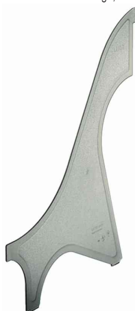
Accessoires: paroi de séparation