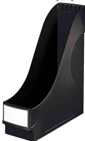
Porte-revue extra large, noir