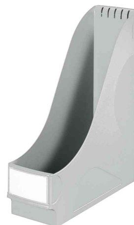
Porte-revue extra large, gris