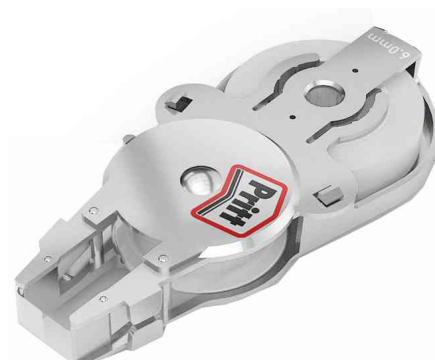
Visuel de référence: Cassette Refill Flex