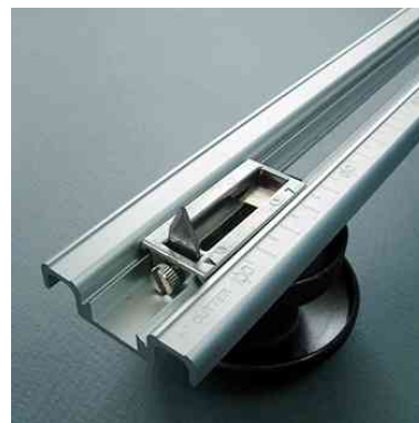
Visuel de référence : vue détaillée de la lame