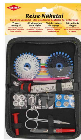
Etui de couture de voyage, petit - dans son emballage