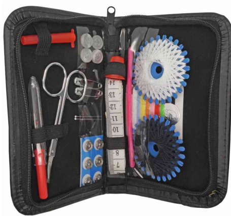
Etui de couture de voyage, petit - ouvert