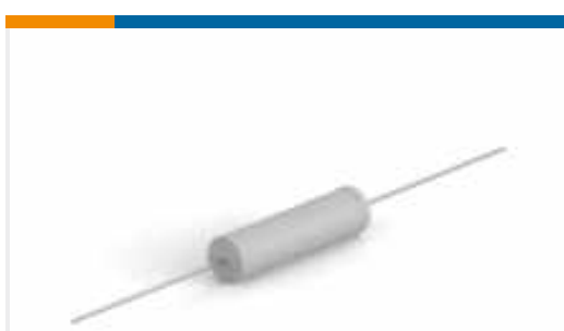
TE Teilnr.:4-2176414-8 7W STD M/OX 5% 1K8