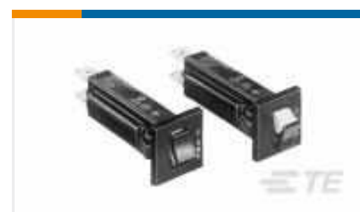
TE Teilnr.:1-1393250-7 W28-XQAT-15=W28