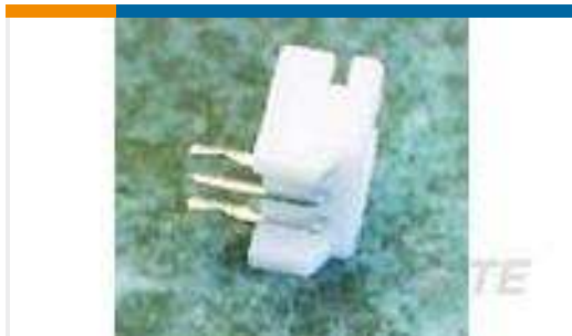
TE Teilnr.:1-440055-1 2.0MM,HDR,11POS,R/A