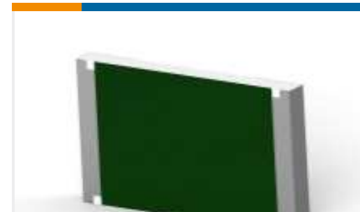
TE Teilnr.:8-2176407-8 3560 27R 5%