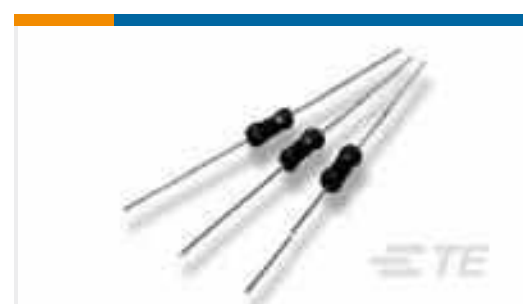
TE Teilnr.:4-1879350-2 RR01 5% 11R AMMO