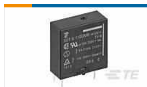
TE Teilnr.:8-1419125-5 SDT-S-106LMR,000