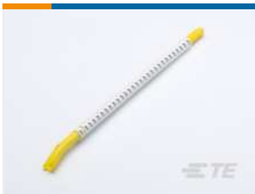
TE Teilnr.:8-1768046-6 STD-Schnappmarkierer