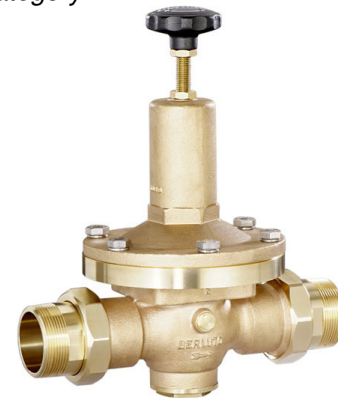
DN 40 - DN 65