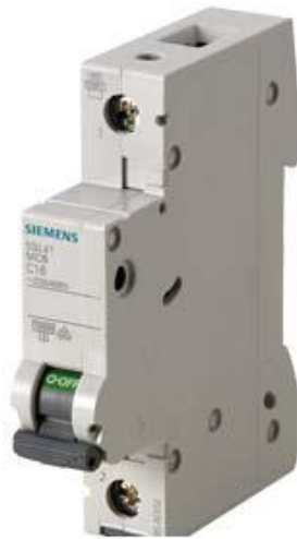
LEITUNGSSCHUTZSCHALTER 230/400V 10KA, 1POLIG, D, 3A