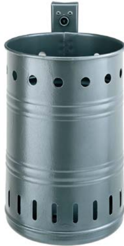
Abfallkörbe, Design „Sicken / gelocht“, wahlweise 20 oder 35 Liter Volumen