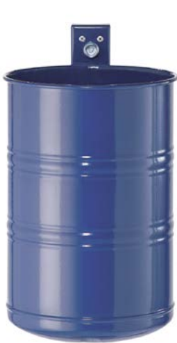
Abfallkörbe, Design „Sicken / geschlossen“, 20 Liter Volumen, Bestell-Nr. 137-470-J9