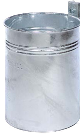
Abfallkörbe, Design „Sicken / geschlossen“, 35 Liter Volumen