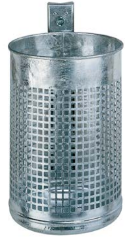
Abfallkörbe, Design „Lochblech“, wahlweise 20 oder 50 Liter Volumen