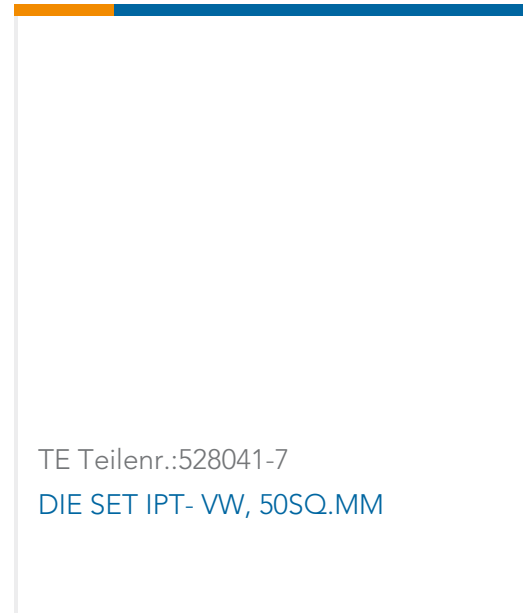
TE Teilnr.:528041-7 DIE SET IPT- VW, 50SQ.MM