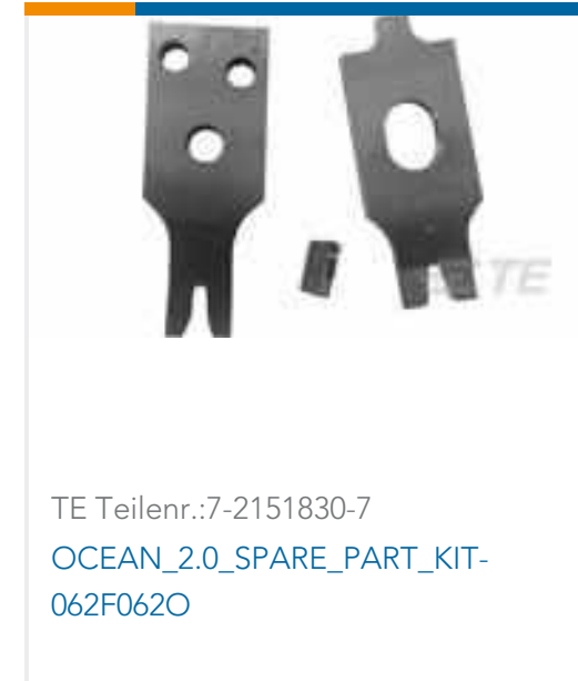
TE Teilnr.:7-2151830-7 OCEAN_2.0_SPARE_PART_KIT-062F062O