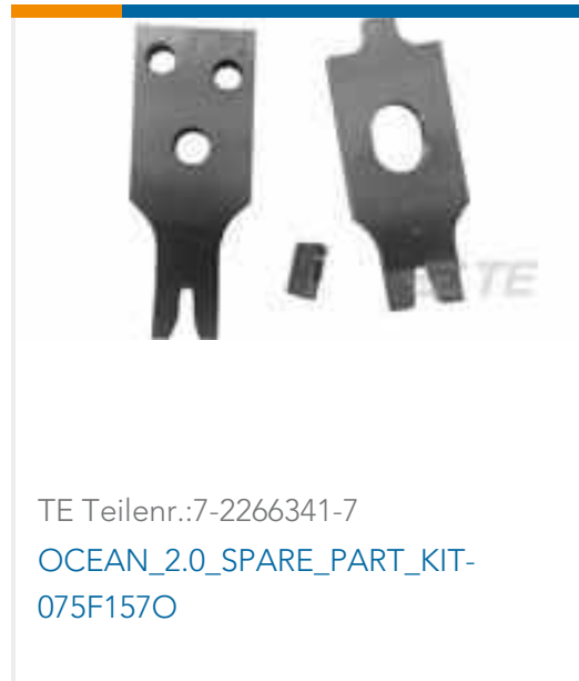
TE Teilnr.:7-2266341-7 OCEAN_2.0_SPARE_PART_KIT-075F157O