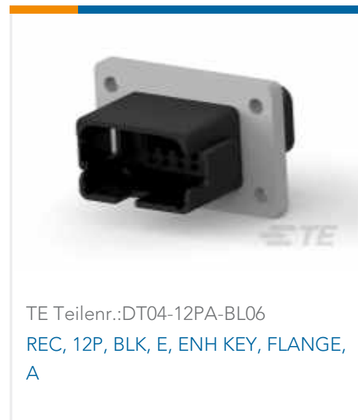
TE Teilnr.:DT04-12PA-BL06 REC, 12P, BLK, E, ENH KEY, FLANGE, A