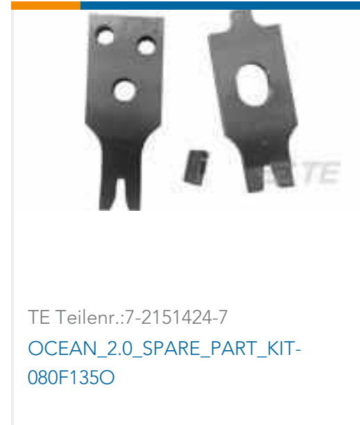
TE Teilnr.:7-2151424-7 OCEAN_2.0_SPARE_PART_KIT-080F135O