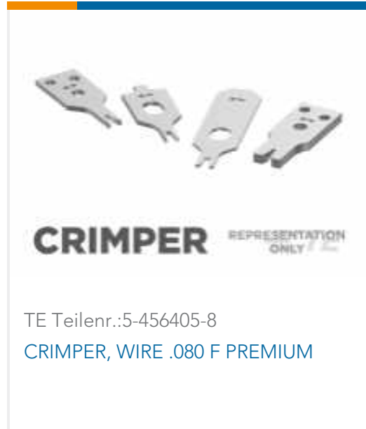
TE Teilnr.:5-456405-8 CRIMPER, WIRE .080 F PREMIUM