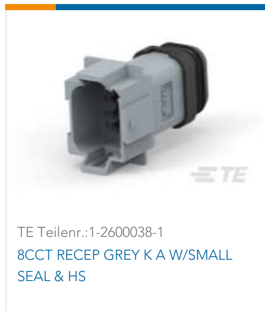
TE Teilnr.:1-2600038-1 8CCT RECEPTOR GREY K A W/SMALL SEAL & HS