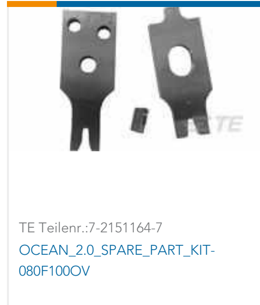
TE Teilnr.:7-2151164-7 OCEAN_2.0_SPARE_PART_KIT-080F100OV