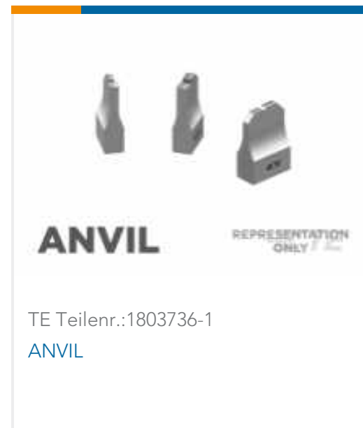
ANVIL REPRESENTATION ONLY