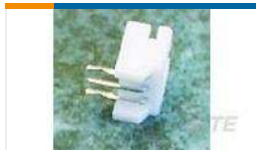
TE Teilnr.:1-440055-1 2.0MM,HDR,11POS,R/A