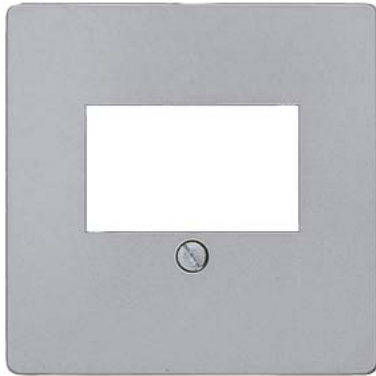
DELTA i-system aluminiummetallic Abdeckplatte TAE-Anschlussdose und Lautsprecher-Anschlussdose 55x 55mm