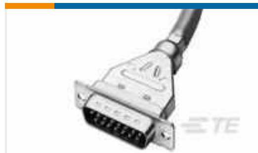
TE Teilenummer5748526-1 KIT,PLUG,9P,HDP-20,SHLD HDWRE