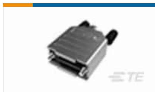
TE Teilenummer3-2198617-7 Ni Plated Plastic Backshell, 37 Way, Str