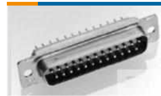
TE Teilenummer1757820-2 AMPLIMITE,ASY,RCPT,STD,109,ZN,2