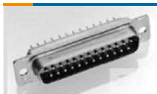
TE Teilenummer1-1757823-0 AMPLIMITE,ASY,PLUG,STD,90,ZN,4,CT