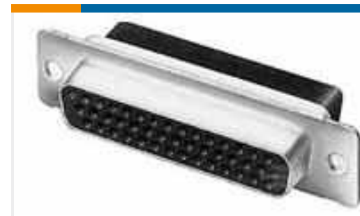
TE Teilenummer1658683-1 HDP-22,RCPT,SIZE 3,44 POSN