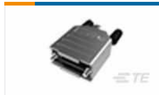
TE Teilenummer2198617-9 Ni Plated Plastic Backshell, 9 Way, Str