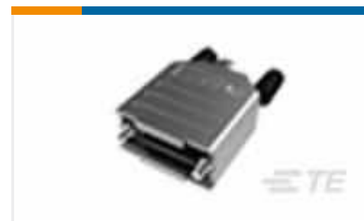
TE Teilenummer2-2198617-5 Ni Plated Plastic Backshell, 25 Way, Str