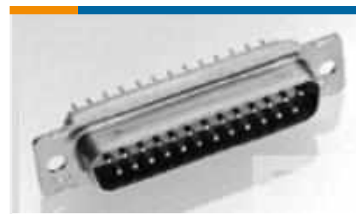
TE Teilenummer1757823-7 AMPLIMITE,ASY,PLUG,STD,90,ZN,1,CT