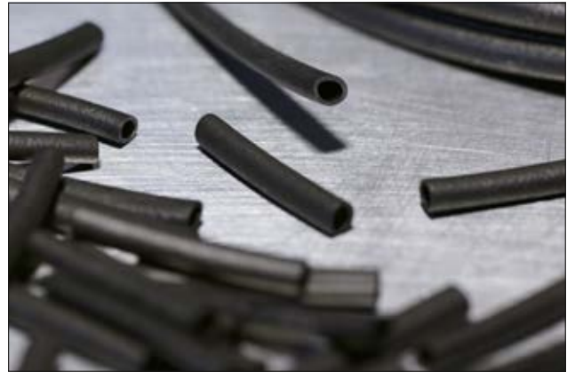
Helsyn H Chloroprentüllen: sehr flexibel und einfach zu montieren.