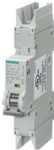
LEITUNGSSCHUTZSCHALTER 10KA, 1-POLIG, D, 16A NACH UL 489 - 277V