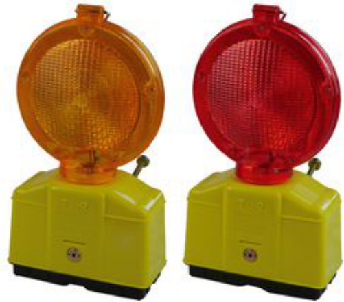
Modellbeispiel: Baustellen-Warnleuchte (v.l. Art. 31211g, 31211r)