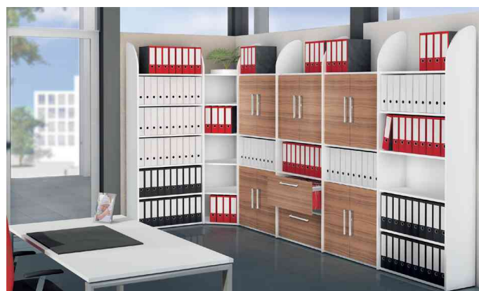
- Anwendungsbeispiel - mit Rückwand