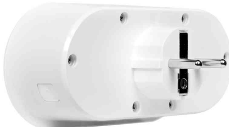
Wi-Fi Smart Plug Adapterstecker, 2-fach + 2x USB