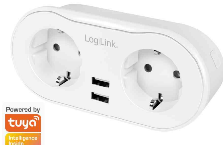
Wi-Fi Smart Plug Adapterstecker, 2-fach + 2x USB