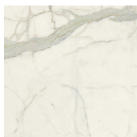
LAVA® CERAMIC, Infrarotheizung, Calacatta (CL)