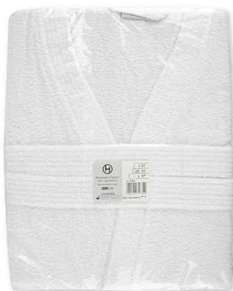
Peignoir de bain Kimono, emballé