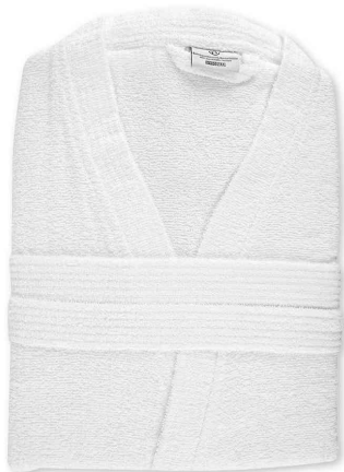
Peignoir de bain Kimono