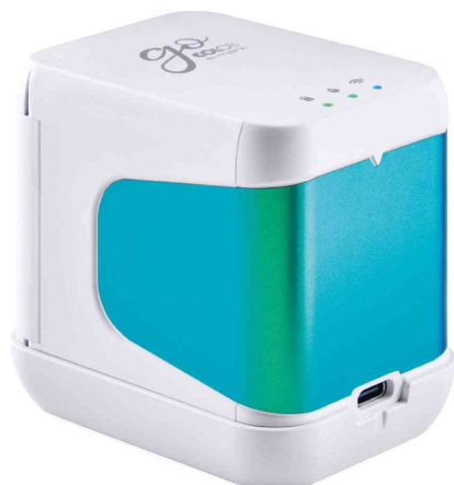
Imprimante mobile e-mark go