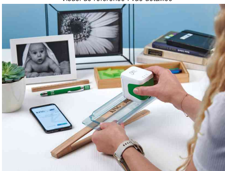
Visuel de référence : montre l'utilisation avec règlette de guidage