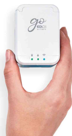
Visuel de référence : vue détaillée