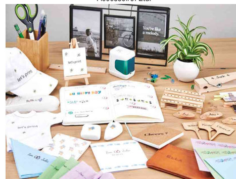
Visuel de référence : montre différentes utilisations possibles