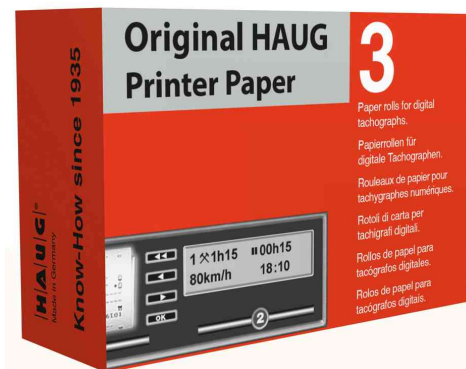
Rouleau de papier thermique HAUG ORIGINAL ECONOMY, emballage