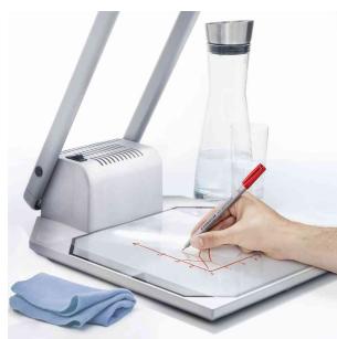
Visuel de référence: présente le produit en utilisation