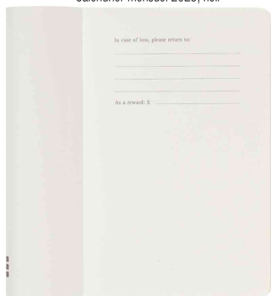
Vue intérieure : rubrique "in case of loss"