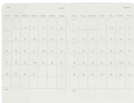
Vue intérieure : aperçu du mois