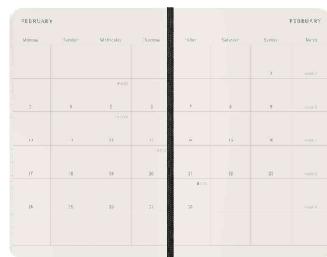
Vue intérieure : 1 mois = 2 pages