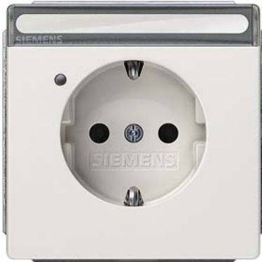
DELTA style platinmetallic SCHUKO Kinders/Betriebsanzeige, Schriftfeld 68x68mm 10/16A 250V