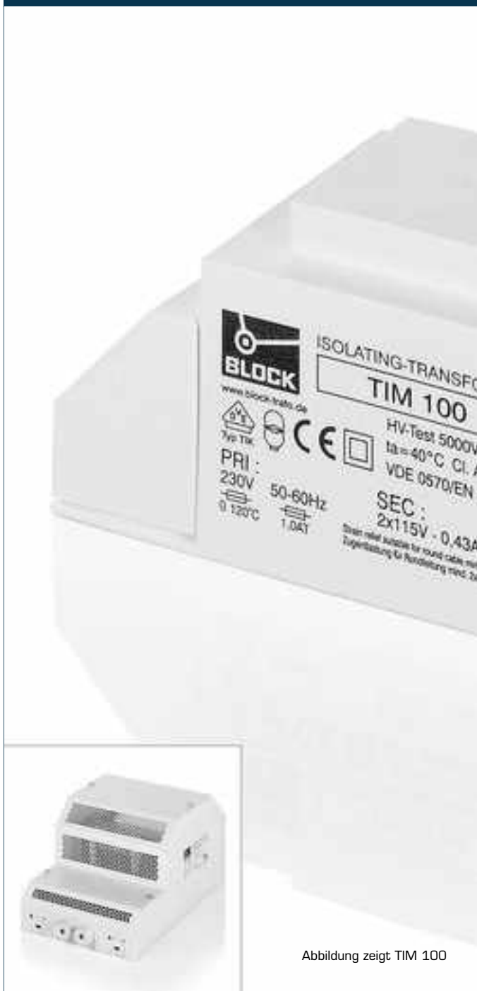
Abbildung zeigt TIM 100