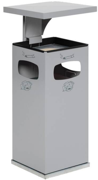
Modellbeispiel: Kombiascher -Cubo Leandro- mit Dach, 38 Liter, in silber (Art. 16962)