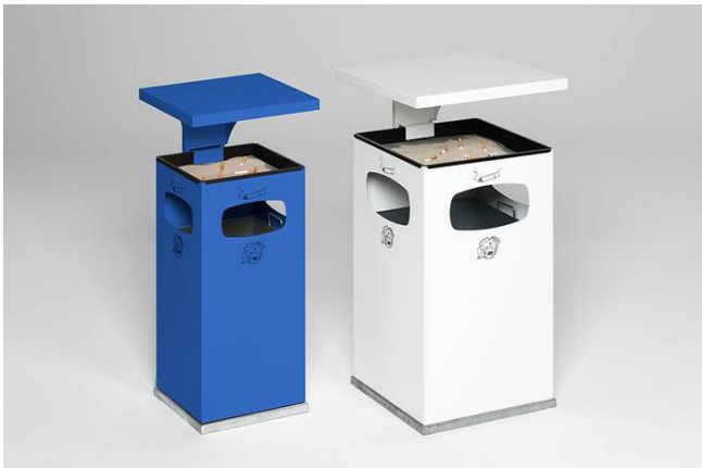
Modellbeispiele: Kombiascher -Cubo Leandro- in enzianbla für 38 Liter (Art. 16960) und in weiß für 72 Liter (Art. 16963)