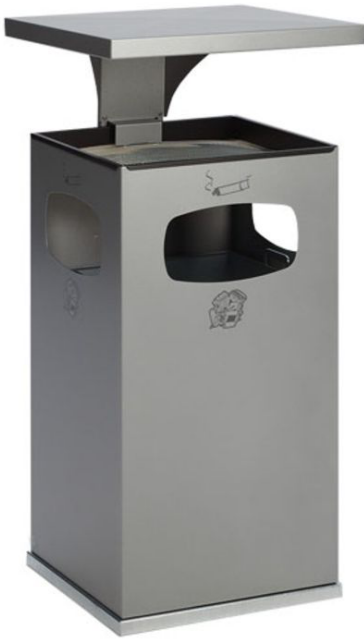
Modellbeispiel: Kombiascher -Cubo Leandro- mit Dach, 72 Liter, in silber (Art. 16969)