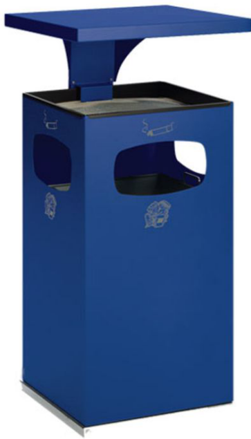
Modellbeispiel: Kombiascher -Cubo Leandro- mit Dach, 72 Liter, in enzianblau (Art. 16967)