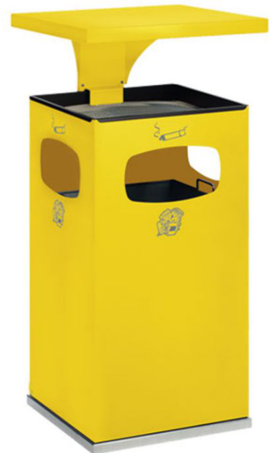
Modellbeispiel: Kombiascher -Cubo Leandro- mit Dach, 72 Liter, in gelb (Art. 16968)