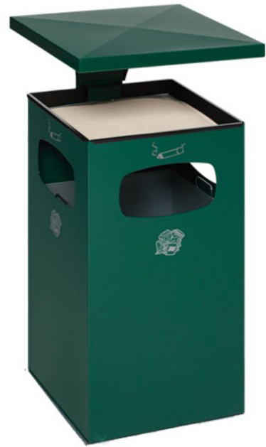
Modellbeispiel: Kombiascher -Cubo Leandro- mit Dach, 72 Liter, in moosgrün (Art. 16966)