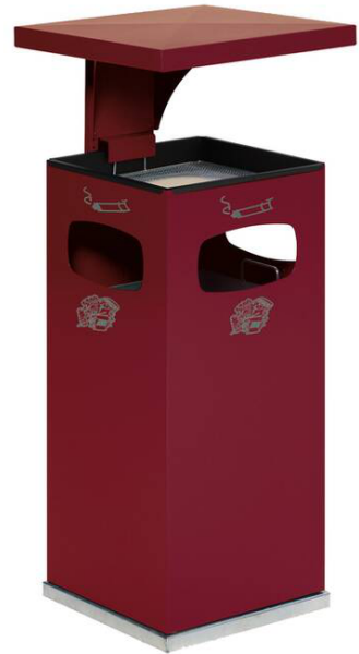
Modellbeispiel: Kombiascher -Cubo Leandro- mit Dach, 38 Liter, in purpurrot (Art. 16957)