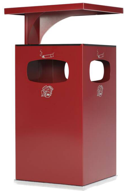
Modellbeispiel: Kombiascher -Cubo Leandro- mit Dach, 72 Liter, in purpurrot (Art. 16964)