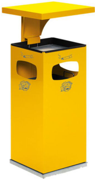
Modellbeispiel: Kombiascher -Cubo Leandro- mit Dach, 38 Liter, in gelb (Art. 16961)