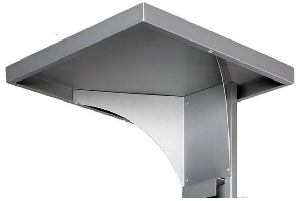
Detailansicht: Dach des Kombiascher -Cubo Leandro- in silber (Art. 16969)