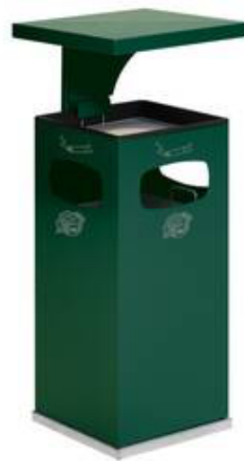
Modellbeispiel: Kombiascher -Cubo Leandro- mit Dach, 38 Liter, in moosgrün (Art. 16959)