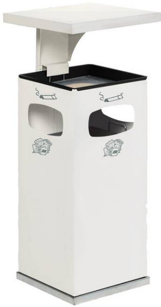
Modellbeispiel: Kombiascher -Cubo Leandro- mit Dach, 38 Liter, in weiß (Art. 16956)