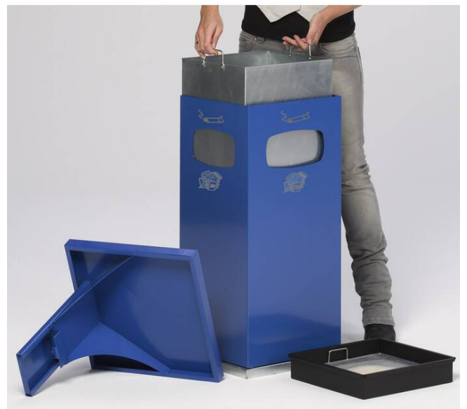
Anwendungsbeispiel: Einfache Entnahme des Innenbehälters des Kombiascher -Cubo Leandro- (Art. 16960)