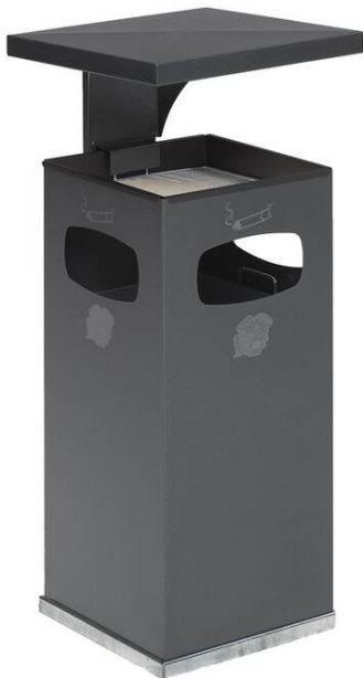
Modellbeispiel: Kombiascher -Cubo Leandro- mit Dach, 38 Liter, in anthrazit (Art. 16958)