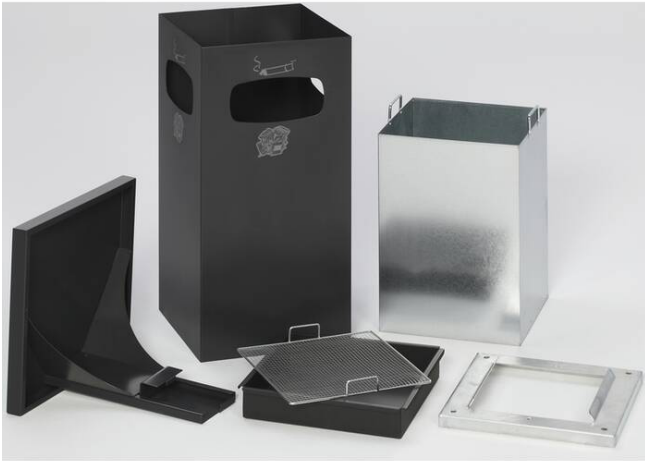
Detailansicht: Bestandteile des Kombiascher -Cubo Leandro- (Art. 16965)